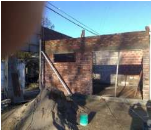
CONSTRUCCION DE PRIMERA