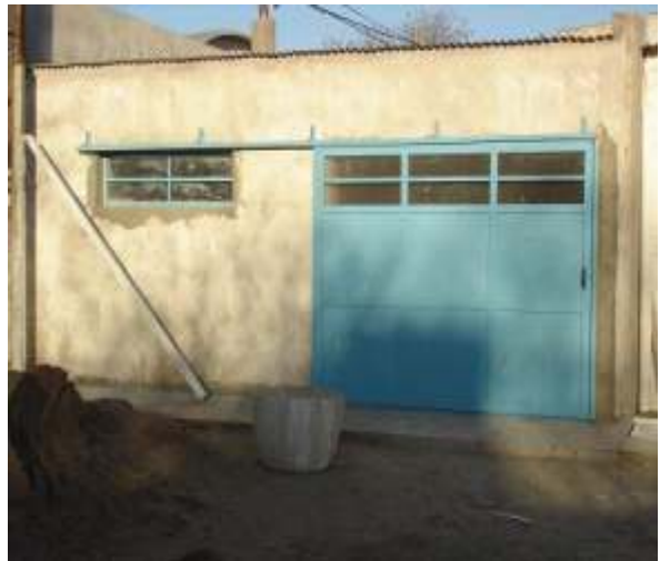
DEPOSITO Y- TALLER